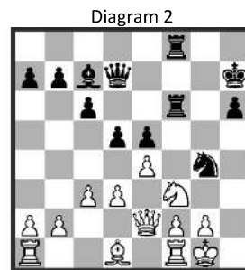
Stelling na: 23. ♙b3-d1

19... ♗a8-f8 20. ♘b1-d2 ♘e7-g6 21. ♘h4xg6 ♗g7xg6 22. ♘d2-f3 ♗g6-f6 23. ♙b3-d1