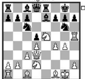
Stelling na: 16... ♗a5-c6